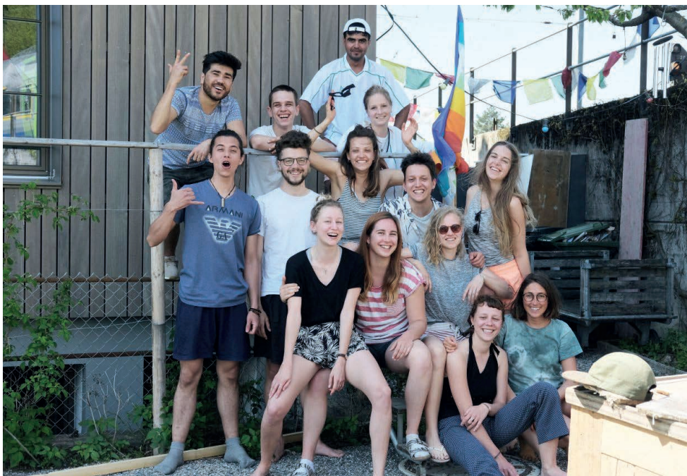
Die Jugendlichen des Vereins Stöckhood leben gemeinschaftlich unter einem Dach.

Der Verein Stöckhood bezeichnet sich als grosse Familie, die WG ist Rückzugsort und stabile Basis für die Bewohnerinnen und Bewohner.