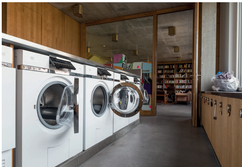
Gemeinschaftsfördernde Architektur in der Siedlung Kalkbreite in Zürich: Waschsalon, Bibliothek, Entrée, Briefkastenanlagen, Aufenthaltsraum

Integration und Ausschluss gehören in sozialen Gefügen untrennbar zusammen. Nachbarschaftliche Beziehungen wirken brückenbauend. Nachbarschaftliches Engagement entsteht nicht aus dem Nichts, es wird mitermöglicht durch räumliche und organisatorische Strukturen (Möglichkeitsräume), die ständig erneuert und erhalten werden müssen. Es benötigt ausserdem einen zündenden Funken, beziehungsweise eine Gruppe Leute, welche ein Nachbarschaftsprojekt angehen und andere zum Mitmachen ermuntern.