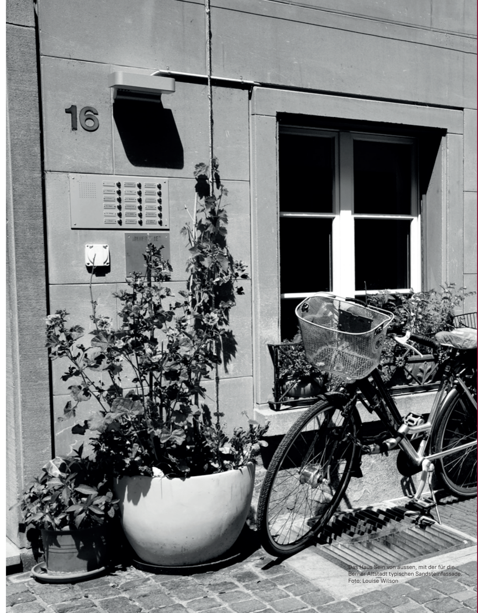
Das Haus Sein von aussen, mit der für die Berner Altstadt typischen Sandsteinfassade.

Weber-Näf, M., Küng, K., & Wilson, L. (2007). Haus Sein. Illustrierter Bericht zu Handen der Age-Stiftung . Abgerufen am 15. Juli 2021 von https://www.age-stiftung.ch/fileadmin/user_upload/Projekte/2006/00071/HausSein_AgeStiftung.pdf