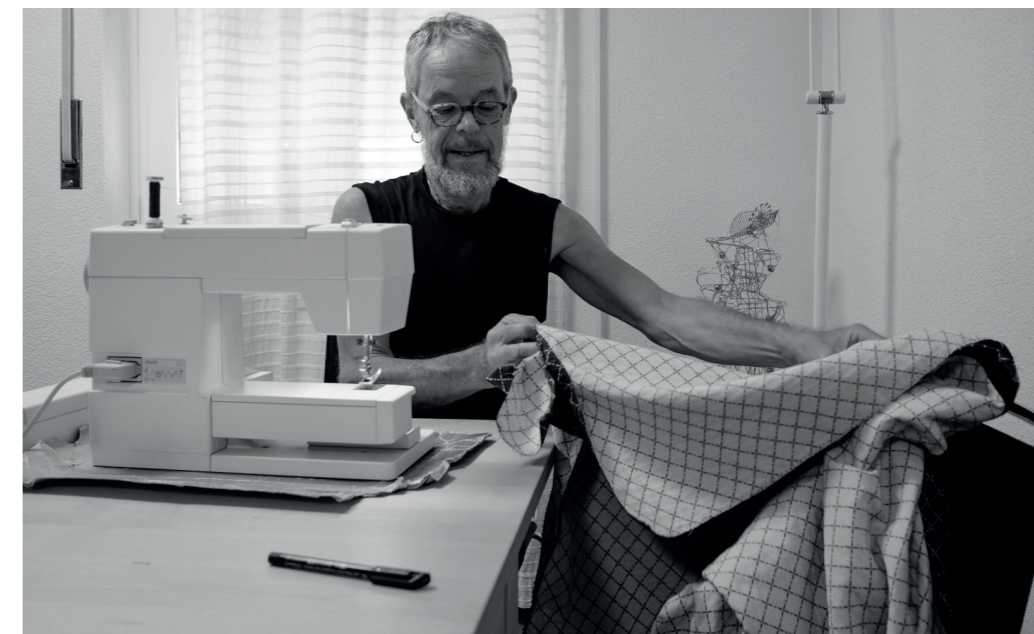
Der Gemeinschaftsraum wird auch für Näharbeiten genutzt.

Das gemeinsame Zusammenleben war nicht immer konfliktfrei. Schon zu Beginn des Projekts, ist ein Meditationsraum zur gemeinsamen und externen Benutzung genutzt