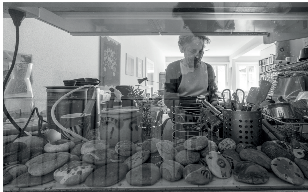
«Mini-Bühnen der Selbstdarstellung» schaffen Sichtkontakt unter den Bewohnenden.