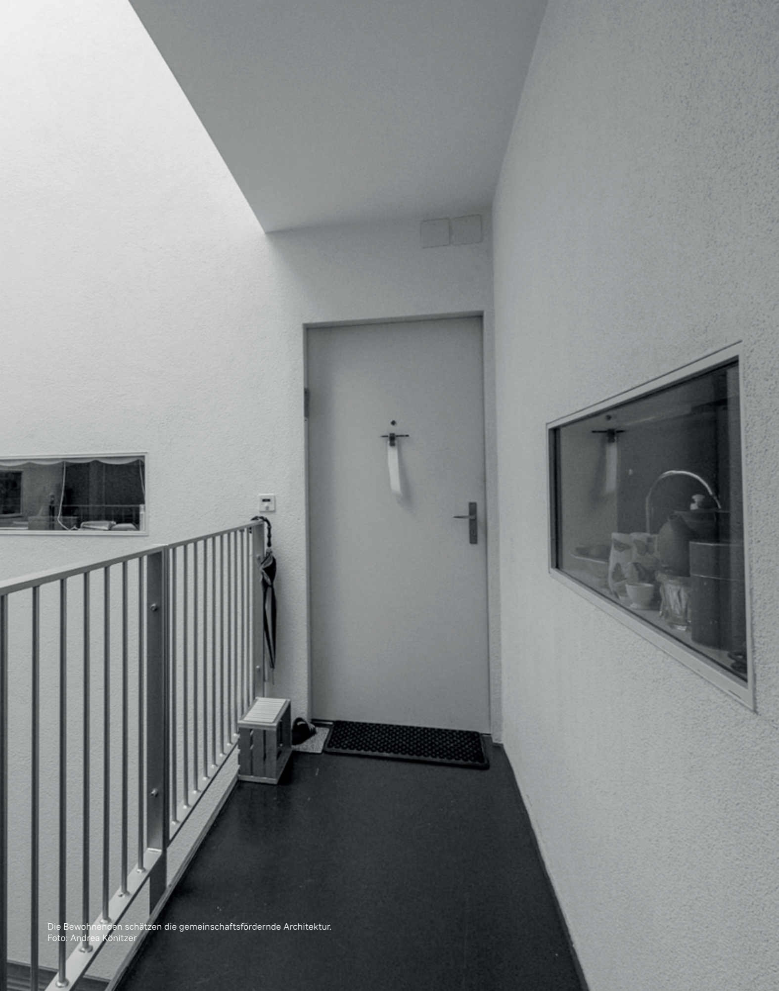
Die Bewohnenden schätzen die gemeinschaftsfördernde Architektur.

Lage des Hauses. Obwohl die Berner Altstadt sehr dicht bebaut und eher dunkel ist, schätzen die Bewohnenden die Nähe zur Aare und zu den Geschäften sowie die gute Anbindung an den öffentlichen Verkehr. Dafür nehmen sie auch den geschäftigen und lärmigen Stadtalltag in Kauf, den sie mit schallisoliertem Fenster draussen halten (Weber-Näf et. al., 2007, S. 31). Zugute kommt ihnen auch, dass an besonders lärmigen Anlässen wie dem Strassenmusik-Festival Buskers oder während der Fasnacht, ihre Gasse gesperrt ist (Interview Wilson 2021).