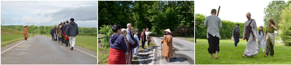
Impressionen vom Retreat